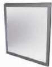
Cristal laminar 3+3