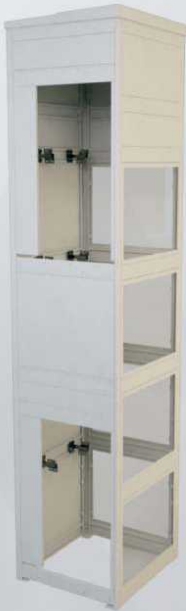
Estructura tipo ESH-2 - ESE-2