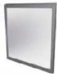
Inox Cristal laminar 3+3