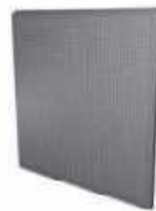
Inox Chapa Perforada