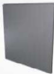
Inox Chapa Ciega